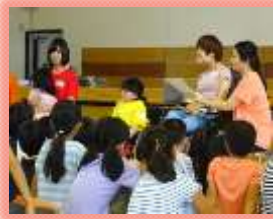
ダンスフィールドとの交流