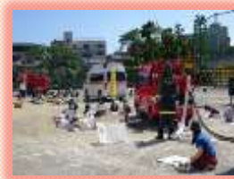
働く消防写生会の実施