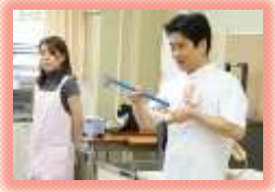
学校歯科医による授業