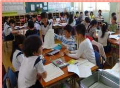
思いや考えを生かす授業