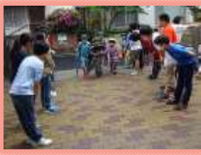
あいさつ運動の充実