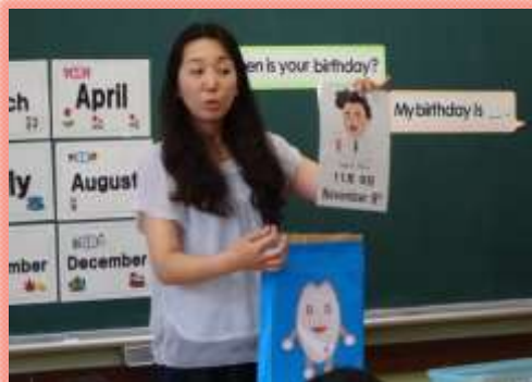
教科外国語・外国語活動の充実