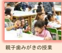
親子歯みがきの授業