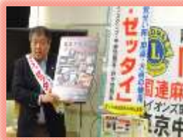
薬物乱用防止教室の開催