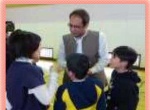
パキスタン大使館との交流