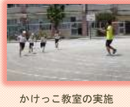
かけっこ教室の実施