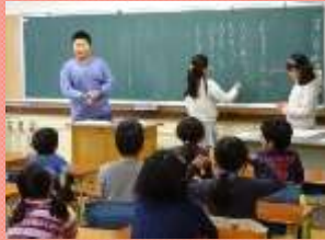
たてわり班活動の充実