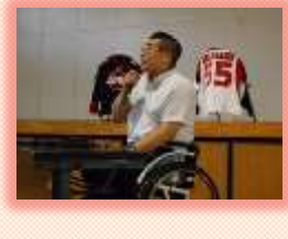
リビ`ック・パ`ラリビ`ック教育の充実