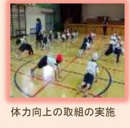
体力向上の取組の実施