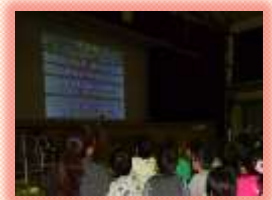
セーフティ教室の実施