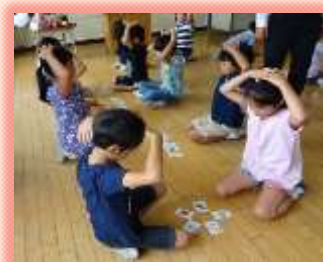
英語タイムの充実