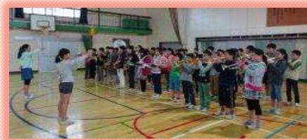
白桜アンサンブルの活躍