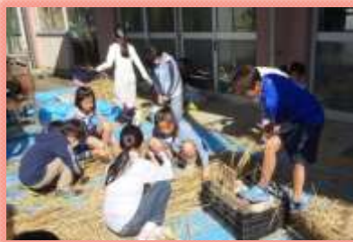
本物に触れあう体験